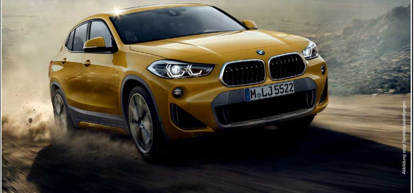
Abbildung zeigt Sonderausstattungen.

Absolut einzigartig. Extrem außergewöhnlich. Lassen Sie sich von dem BMW X2 und seinem Design begeistern. Für ein sportliches Fahrgefühl sorgen leistungsstarke Motoren. Verschiedene, optional erhältliche Features ermöglichen eine nahtlose Vernetzung. Vereinbaren Sie jetzt Ihre persönliche Probefahrt mit dem BMW X2 und profitieren Sie von attraktiven Konditionen wie dem Business Paket 1 .