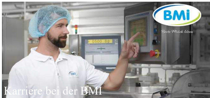
Karriere bei der BMI

Zweckverband zur Wasserversorgung der Betzensteingruppe, Alter Brunnen 2, 91282 Betzenstein