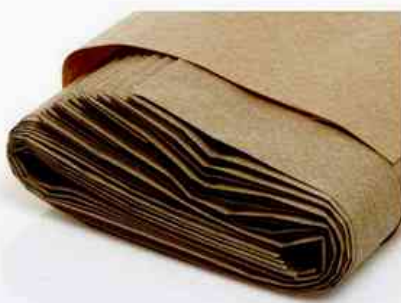
Biomüllbeutel aus Papier

Als Alternative zur Sammlung von Bioabfällen im Haushalt stehen im Handel erhältliche Papierbeutel zur Verfügung, die problemlos mit in die Biotonne gegeben werden können. Man kann die Bioabfälle ebenso in Küchenkrepp oder Zeitungspapier einwickeln. Zum Schutz vor Feuchtigkeit können auch Plastikbeutel verwendet werden, wenn diese nach der Entleerung des Inhalts in die Biotonne separat mit dem Restmüll entsorgt werden.