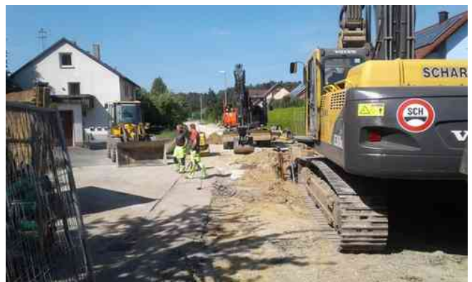
Schweres Gerät beim Kanalbau in Siegmansbrunn

Die Hauseigentümer werden dann über die auf Privatgrund noch durchzuführenden Anschlussarbeiten der Grundstücksentwässerungsanlagen unterrichtet.