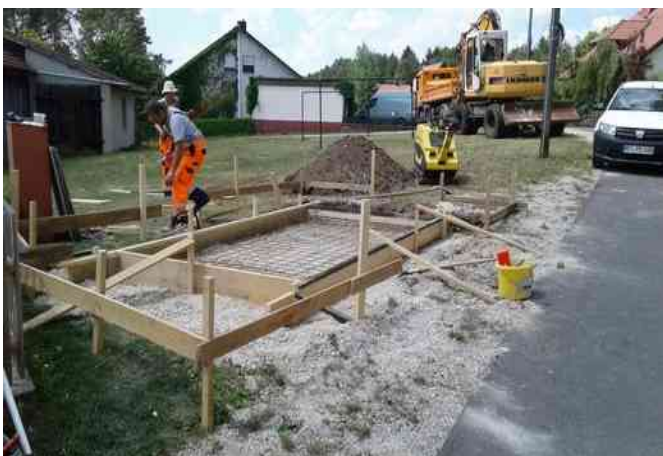
Fundamentarbeiten für das neue Bushäuschen in Weidenhüll bei Elbersberg

Im Zuge des durch den Landkreis Bayreuth geplanten Kreisstraßenausbaus soll auch in Geusmanns ein entsprechendes Bushäuschen errichtet werden.