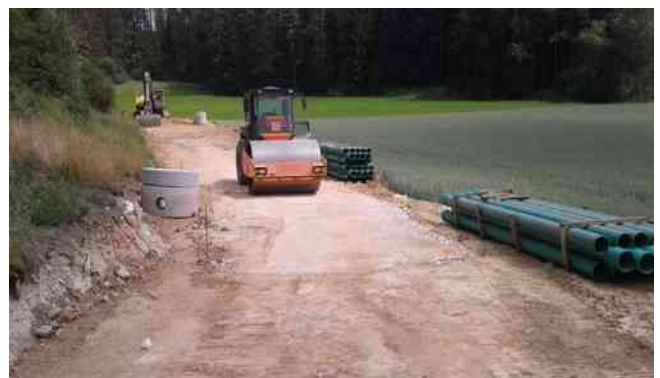
Herstellung des Unterbaus für den geplanten Mehrzweckweg von Siegmansbrunn zum Gewerbegebiet Pottenstein. Die Rohre für den Schmutzwasserkanal liegen bereit.