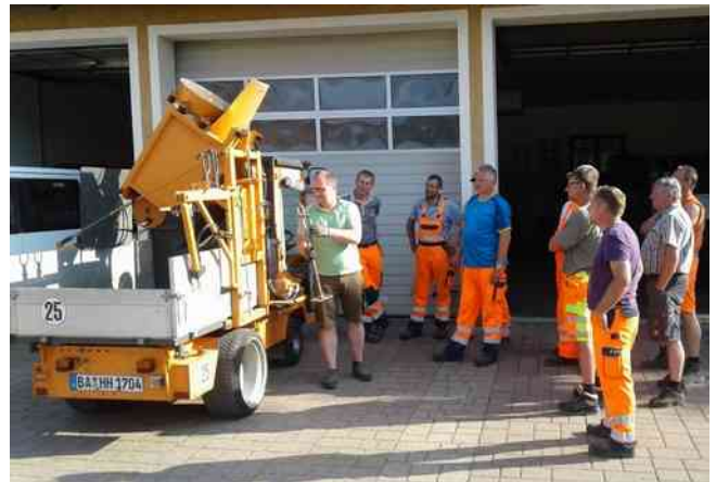
Unterweisung der Bauhofmitarbeiter aus den beteiligten Gemeinden am Bauhof Pottenstein.

Insgesamt können so in relativ kurzer Zeit die in der Unterhaltlast der Gemeinde liegenden Straßeneinläufe (ca. 930 Stück) gereinigt werden.