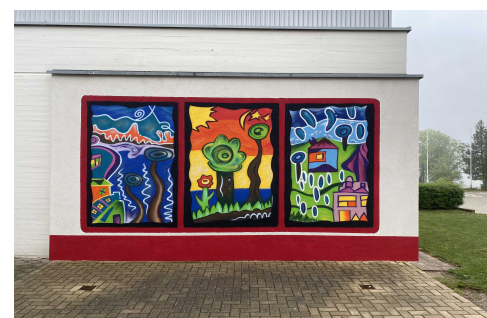
Die fertigen Werke an der Pausenhofwand.